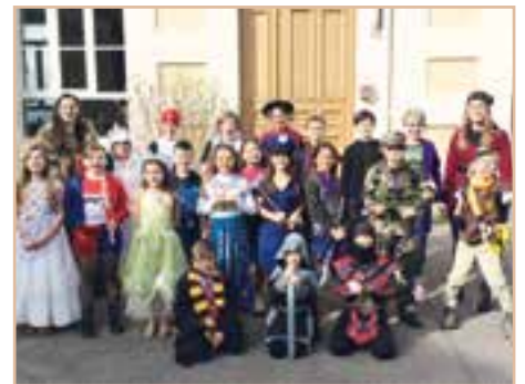
Carnaval de l'école