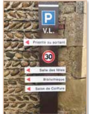
Renouvellement de mobilier signalétique