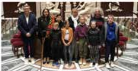
Dans l'hémicycle de l'Assemblée nationale, à Paris.

Le conseil municipal junior était à Paris du 22 au 24 avril, encadré par le maire de Moras-en-Valloire Aurélien Ferlay, Hélène Crocorno, Danièle Conjard, en délégation du conseil adulte. Au programme de ce séjour citoyen, visite des monuments de la capitale et immersions dans les institutions de la République. Après l'Assemblée nationale, le Panthéon, le Sénat, les jardins du Luxembourg, le musée du Louvre, place à l'Arc de Triomphe et la tombe du Soldat inconnu, suivis d'une escapade en bateau-mouche et une halte surélevée à la tour Eiffel. Le musée des Égouts de Paris figurait dans le cadre d'un cours sur le cycle de