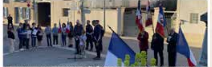
Face au monument aux morts de Moras-en-Valloire, les jeunes élus ont lu le message de l'Union Régionale des anciens combattants (U.R.A.C.).

La cérémonie commémorant la Journée nationale du souvenir et de recueillement à la mémoire des victimes civiles et militaires de la guerre d'Algérie et des combats en Tunisie et au Maroc s'est tenue mardi 10 mars, en présence des membres du comité de la Fédération