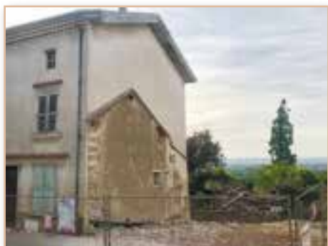
Démarrage des travaux en cœur de village pour la boulangerie