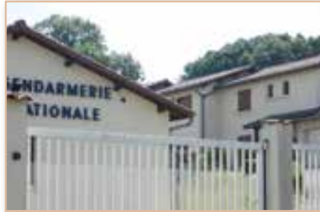
Rénovation de salles de bains et du sol d'une salle de réunion à la Gendarmerie