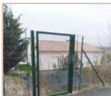
Reprise du portillon au bassin de rétention du Bellevue *