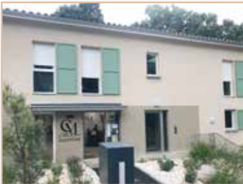
Construction du nouveau salon de coiffure et de logements Place du 19 mars 1962