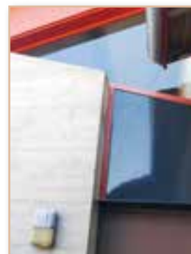
Reprise et étanchéisation de menuiseries de la salle des fêtes *