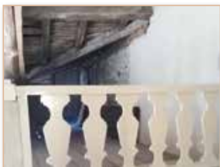
Sécurisation du plancher et des balustres de la Maison Carrée *