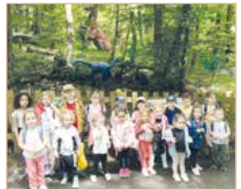
Sortie au safari de Peaugres