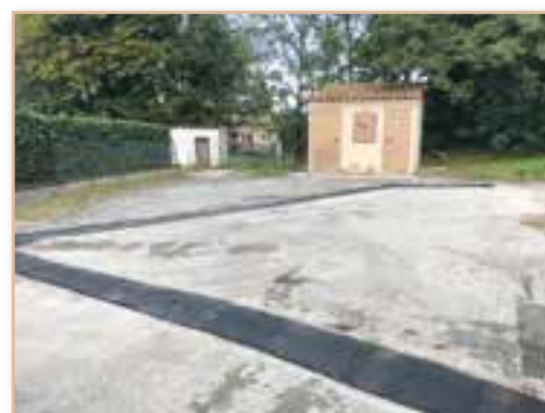
Reprise de grilles d'eaux pluviales allée des quatre vents