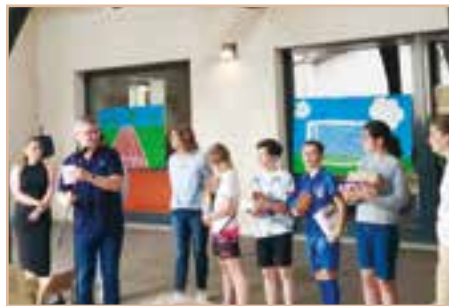
Remise des dictionnaires aux CM2