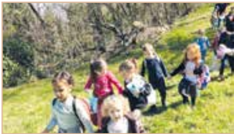
Classe hors les murs