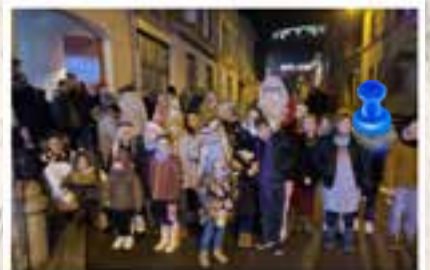
Le départ du défilé dans les rues illuminées du centre bourg.