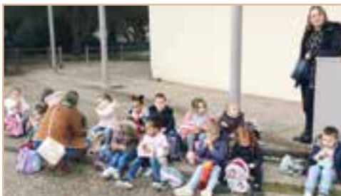
Sortie cinéma à St-Vallier