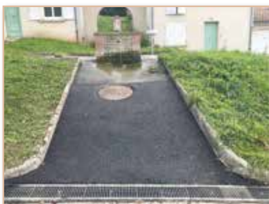
Rajout de grilles d'eaux pluviales à La Fontaine des Ramus