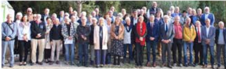
L'Association des maires ruraux de la Drôme réunie en assemblée générale à Bois-les-Baronnies.

L'assemblée générale de l'Association des maires ruraux de la Drôme s'est tenue dans les Baronnies samedi 21 octobre. L'occasion pour ces représentants locaux de s'exprimer sur des sujets spécifiques à leur mandat : l'eau, la loi "ZAN" (zéro artificialisation nette des sols), les budgets, le loup, le statut de l'hu, etc.