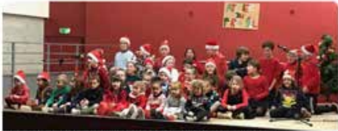
Sur scène, les petits latins ont donné le meilleur d'eux-mêmes.

Noël a été fêté avant l'heure pour les enfants de l'école, ce vendredi 22 décembre, à l'occasion des vacances. Avec un menu de circonstance à Noël, servi