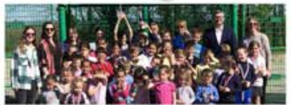
Encadrés par les enseignants et les élus, les enfants ont reçu leurs trophées.

Le cross scolaire s'est déroulé vendredi 12 avril sur l'aire sportive du parc. Deux catégories par l'équipe enseignante et sous les encouragements des familles, les élèves des classes maternelles et élémentaires ont participé pour effectuer leurs tours de piste.