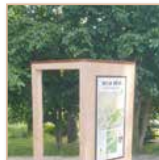
Restauration de la porte des boucles de randonnées au parc municipal

Les travaux marqués d'un astérisque* ont été au moins partiellement réalisés « en interne » par les agents et/ou les élus municipaux eux-mêmes afin d'en réduire les coûts.