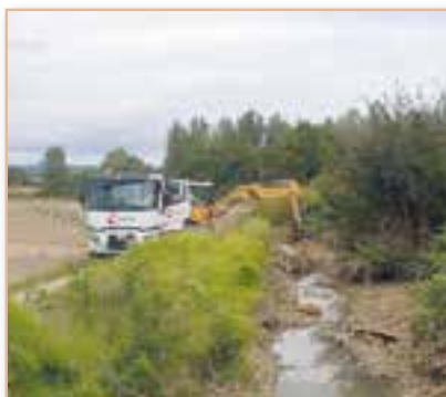
Enlèvement d'embâcles cours d'eau de la Vauverière *