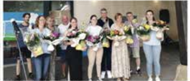
Aux côtés des élus, les enseignants récompensés.

La fête de fin d'année scolaire et sa kermesse ont eu lieu samedi 29 juin, en présence du maire Aurélien Ferlay et des élus. L'occasion pour les parents et familles, de découvrir le spectacle des enfants autour du thème du sport, préparé par l'équipe enseignante.