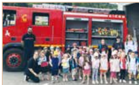
Visite du centre d'incendie et de secours