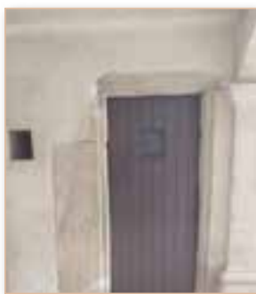
Rénovation de porte sous les escaliers Renaissance de la mairie *