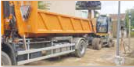
Travaux d'urgence, curage et nettoyage après les intempéries d'automne *