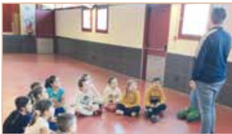
Cycle découverte de l'escrime