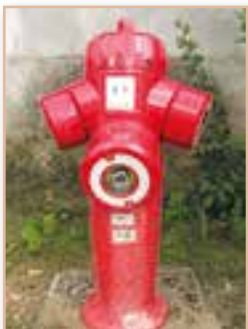
Changement d'une borne incendie Route des vergers