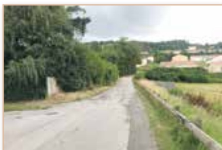
Enfouissement de réseaux secs chemin de la gendarmerie