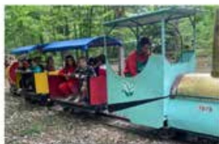
Le petit train du muguet circule une fois par an, depuis un demi-siècle... Ci-dessous : le Bœuvill d'Épinouze est fidèle à ce rendez-vous. 450 litres de pâte ont été utilisés à la confection des gaufres, cuites au feu de bois.