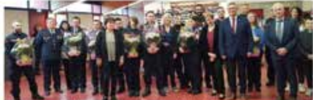
La grande famille des pompiers réunie en ce jour de Sainte-Barbe.