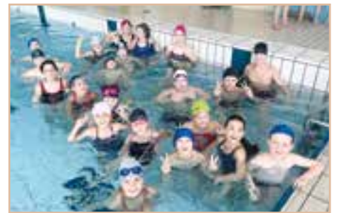
Natation scolaire à Châteauneuf-de-Galaure