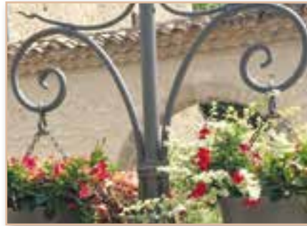
Fleurissement de la commune *