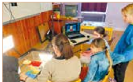
Réalisation d'un film d'animation