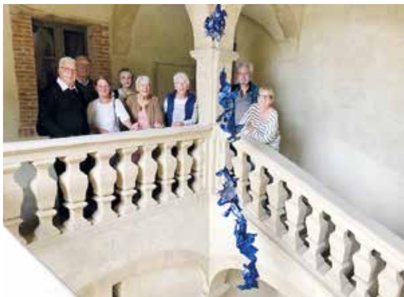
L'escalier Renaissance de la Maison Quarrée à Moras

Pour terminer ce beau voyage direction Peyrins pour aller voir l'église Saint-Ange.