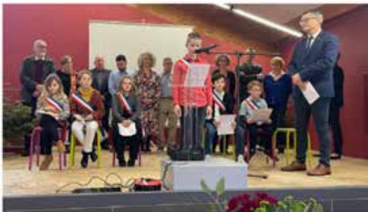
La municipalité morassienne (adultes et enfants) aux côtés du maire Aurélien Ferlay.

Ce dimanche 7 janvier, ce sont les enfants du conseil municipal junior qui ont ouvert la traditionnelle cérémonie des vœux du maire Aurélien Ferlay, en présence du conseil adultes, de nombreux invités, maires et élus des communes voisines, autorités civiles et militaires et des Morassiens. Des vœux de santé, de bonheur, d'épanouissement et de réussite formulés par l'édile. Rappelant les valeurs d'universalité et de républicanisme face au déferlement de la folie des hommes, Aurélien Ferlay est revenu sur les temps forts qui ont marqué l'année écoulée dans différents domaines : infrastructures communales (requalification et modernisation de la zone d'activités du Val-Por, réalisations immobilières, fibre optique, impacts subis lors des dernières inondations), rendez-vous avec les habitants (rencontres de quar-