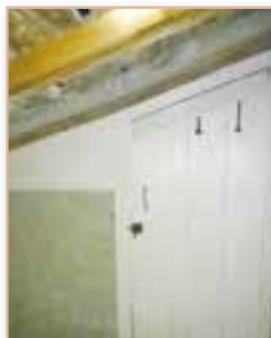
Reprise des fermetures du grenier de la mairie *