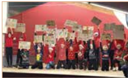
Fête de Noël