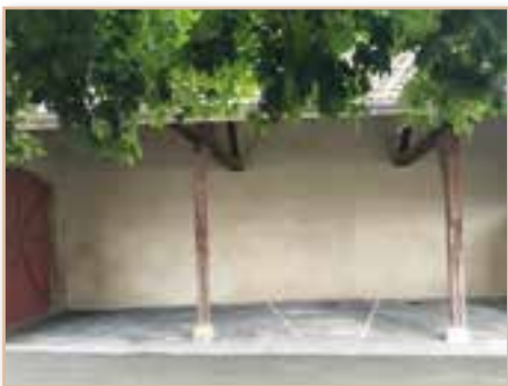
Rénovation d'un préau de l'école