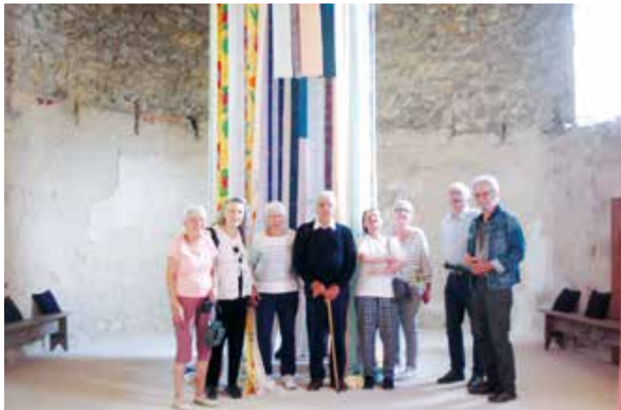
L'église du Charaix

Mentionnée comme lieux de culte en l'an 995, l'église actuelle est plus tardive, sa construction a eu lieu au cours des 11 et 12 èmes siècles.