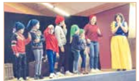
Spectacle « Panique au pays des contes » de la Chouette Comédie