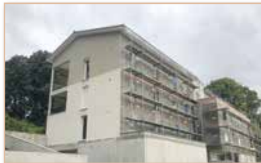
Construction de la résidence Le Haut des Ramus