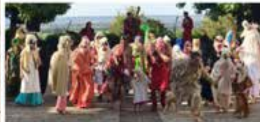
La danse des sauvages, une chorégraphie qui a réveillé les monstres qui sommeillent.

Clôture de la saison estivale en Forêt de Drôm-Ardèche, en partenariat avec la municipalité, la compagnie Quelques Parts a présenté, ce dimanche 3 septembre, place Justin-Achard, le théâtre des monstres... Enfants sauvages, hommes bêtes et femmes épouvantails volontaires ont endiablé ce bal participatif pour le plus grand plaisir des spectateurs.