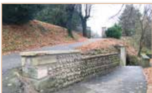
Restauration d'un muret Place de l'église