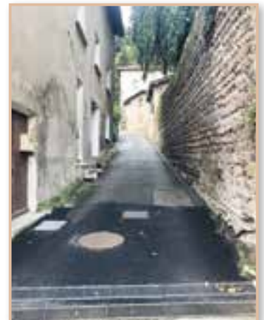
Reprise de grilles d'eaux pluviales rue du pressoir