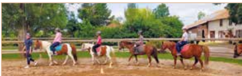
Sortie équitation à Taravas