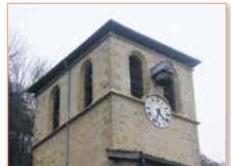
Rénovation de la porte du clocher de l'église *