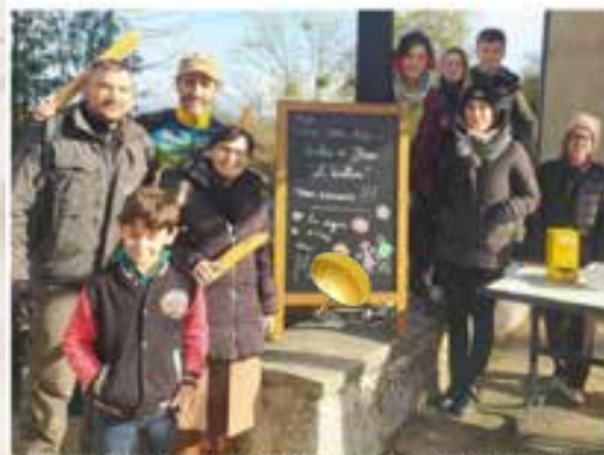
L'association des parents d'élèves contribue à l'organisation de projets pour les enfants.

Moras-en-Valloire • Ils ont randonné pour les enfants