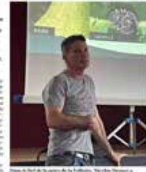
Présentation de la punaise diabolique, ravageuse de cultures, est ouverte !

La punaise diabolique ou Pentatomidae (Pentatomidae) est un insecte nuisible aux cultures. Pour lutter contre ce ravageur, une stratégie globale est mise en œuvre, associant des mesures préventives et curatives. Les agriculteurs sont encouragés à surveiller leurs cultures et à signaler toute présence de punaises. Des formations sont organisées pour aider les agriculteurs à reconnaître et gérer ce ravageur. Des produits phytosanitaires sont disponibles pour lutter contre la punaise diabolique. Des mesures de lutte biologique sont également envisagées. La lutte contre la punaise diabolique est un travail de longue haleine qui nécessite la collaboration de tous les acteurs du territoire agricole.